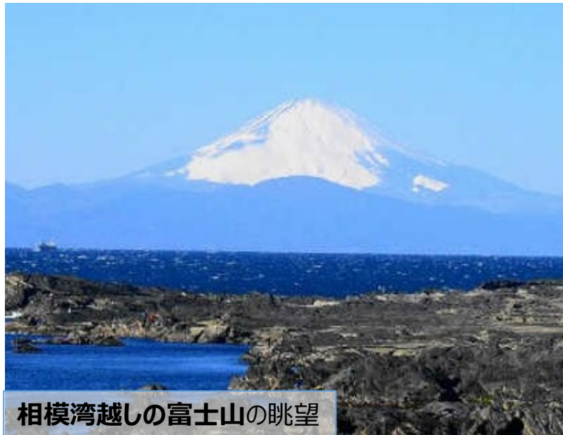
相模湾越しの富士山の眺望