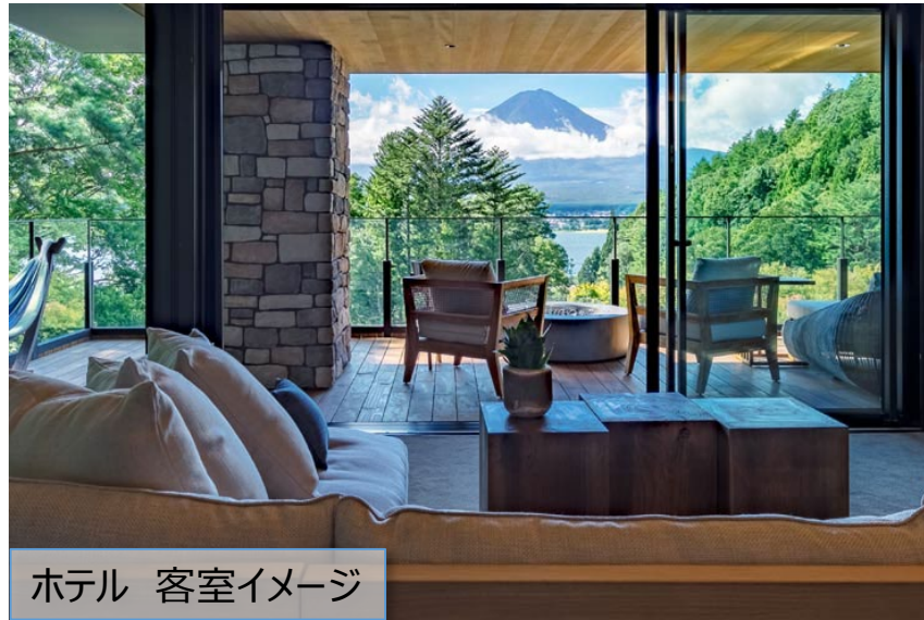
ホテル 客室イメージ

アフターコロナを見据え、城ヶ島西部地区の優位性を最大化し国際競争力を高めるとともに、現在進行している二町谷地区海業プロジェクトによる国家戦略特区を活用した国際的な経済活用拠点形成との相乗効果の早期発現を図る。