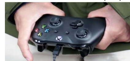
▲ハンドル代わりのコントローラー (例)