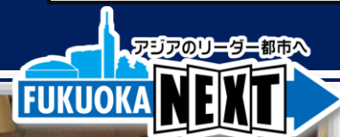
福岡市 グローバル創業・雇用創出特区