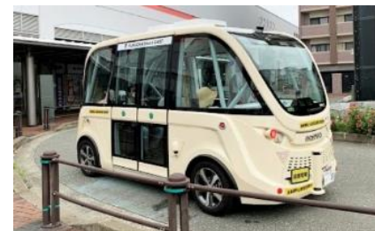
▲自動運転バス (全長4.75m、定員11名)