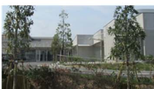
チャイルド・ケモ・ ハウス 小児がん患者と家族を 対象とした滞在施設で診 療所を併設(19室)