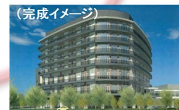
(完成イメージ) 神戸国際フロンティアメディカル センター(H26開設予定)

小児疾患、周産期医療の全県における拠点病院(290床) 小児がん拠点病院(厚労省) 付帯施設として、粒子線治療施設の整備を計画(H29年度開設予定)