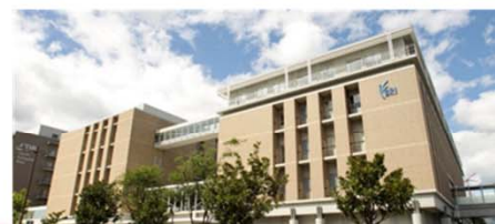
先端医療センター

基幹病院として、救急医療・高度医療・急性期医療を重点に担い、神戸市民の生命と健康を守る拠点病院(700床)