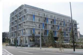
西記念ポートアイランド リハビリテーション病院 急性期を脱した早期回復 期リハビリテーションを提供する病院 (136床)