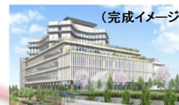
(完成イメージ) 兵庫県立こども病院 (H28春開設予定)

医療機器の研究・開発、医薬品等の治験、再生医療等の実用化を行う施設(60床) 日本主導型グローバル臨床研究病院(厚労省) 橋渡し研究加速ネットワークプログラム拠点機関(文科省)