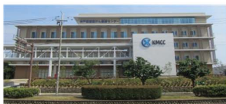
神戸低侵襲がん医療センター 放射線治療などにより切らない (=低侵襲)がん治療を行う病院 (80床)