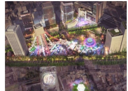
活用イメージ（仮設興行場）