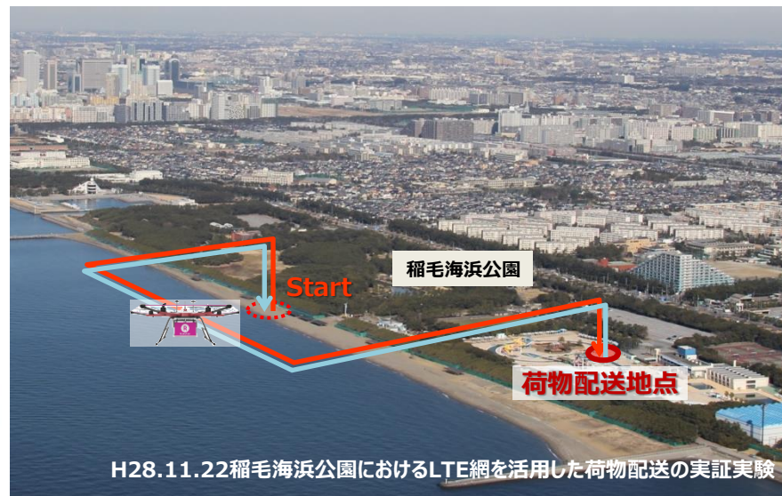
H28.11.22稲毛海浜公園におけるLTE網を活用した荷物配達の実証実験