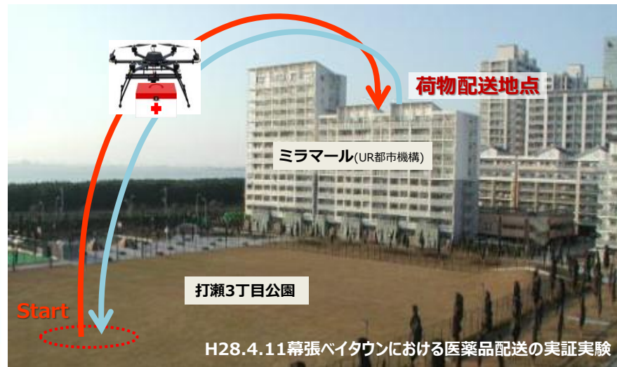
H28.4.11幕張ベイタウンにおける医薬品配達の実証実験