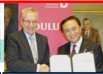
フィンランド・オウル市とのMOU締結