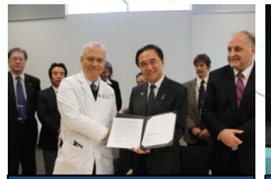
退役軍人省ハロア尔特・ヘルスケアシステムとのMOU締結