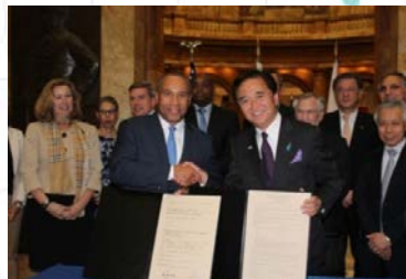
マサチューセッツ州とのMOU締結