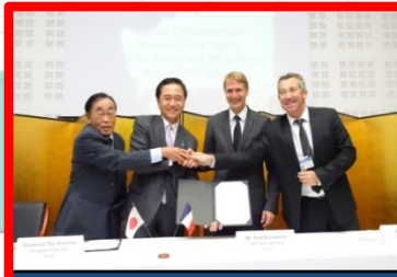
フランス政府関係機関 CVT-SudとのMOU締結