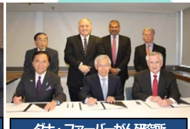
ダナ・ファーマーがん研究所とのMOU締結