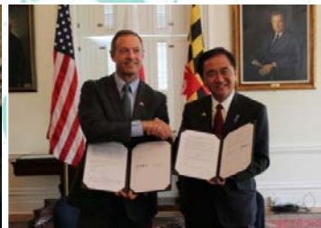
メリーランド州とのMOU締結