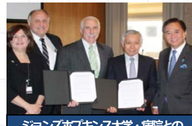
ジョンズホプキンス大学・病院とのMOU締結