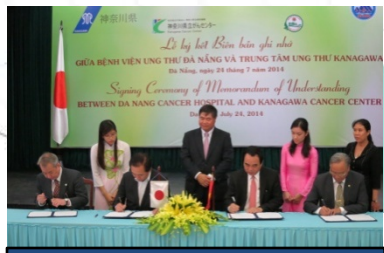
ベトナム・ダナンがん病院とのMOU締結