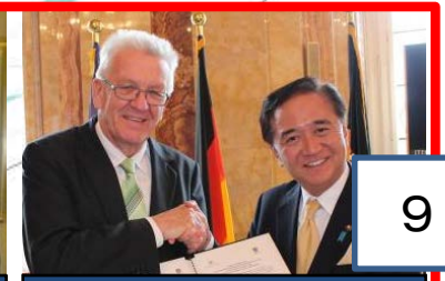
バーデン・ヴュルテンベルク州(ドイツ)との覚書の締結