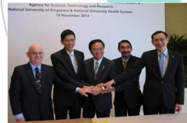
シンガポール政府機関とのMOU締結