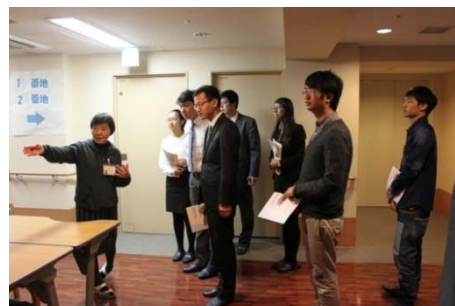
新宿けやき園(グループの医療福祉施設)を視察する留学生(2014.1)