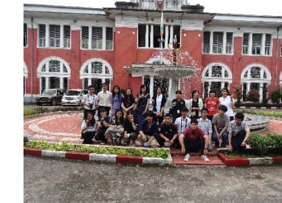
ヤンゴンへの学生派遣(2014.08)