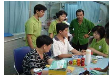
本学教員による外来での現地指導 (2006.1)

2014年10月には、本学関係者がベトナム保健大臣を表敬訪問し、今後の協力について意見交換を行い、チョーライ病院から提案のあった、予防医療等の分野での協力についても、大臣からは全面的に支援するとの発言がありました。今後はこれらの分野において、積極的な協力を推進していきます。