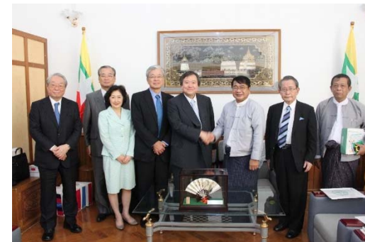
タン・アウン保健大臣との協議(2014.10)