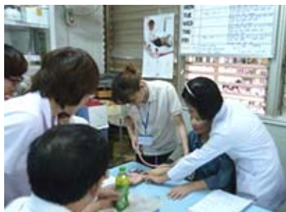
ベトナム 国立チョーライ病院における研修風景(2011.8)