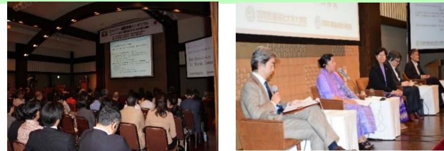
ミャンマー国際医療シンポジウム(2014.07)

2014年11月には、経済産業省からの委託事業として、ヤンゴン第一医科大学と国際医療福祉大学三田病院をインターネットでつないだ、遠隔診断実証実験を行い、成功を収めました。今後は、この結果を活用し、遠隔診断機能を有する研修センターの設立等について検討を進めてまいります。