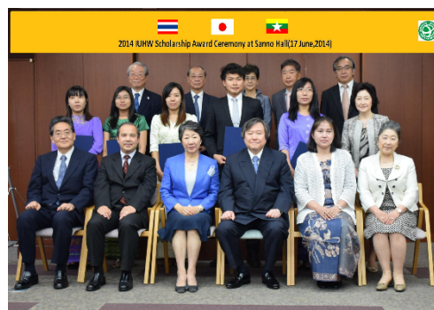
2014年度IUHW奨学生 奨学金授与式 (2014.6)