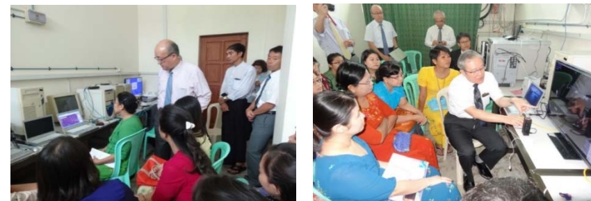
遠隔診断実証実験(2014.11)