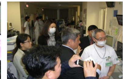
ベトナム保健省副大臣他の三田病院視察 (2014.1)