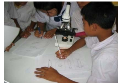
タイにおける学校保健の様子