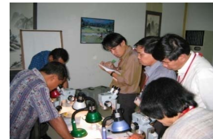
タイ国際研修(人材育成)