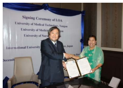
ヤンゴン看護大学との協定調印(2013.12)