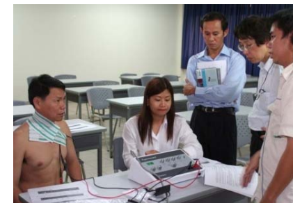
カンボジアにおける物理療法機器検査