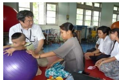
ミャンマーでのリハビリ指導の様子 (2008.7)

またミャンマーとの相互交流を更に推進するため、2013年度は、ミャンマーの医療系大学3校(ヤンゴン第一医科大学・ヤンゴン医療技術大学・ヤンゴン看護大学)と 学術交流協定を締結し、2014年8月には、本学学生(11名)と教職員(2名)をヤンゴンへ派遣し研修を行うとともに、現地の学生・教職員との交流を深めました。