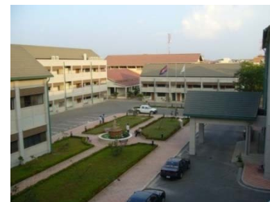
カンボジア医療技術学校