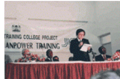
ケニア・ナイロビのカレッジにて講演(1998)