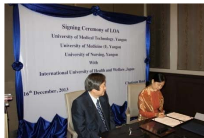
ヤンゴン第一医科大学との協定調印 (2013.12)