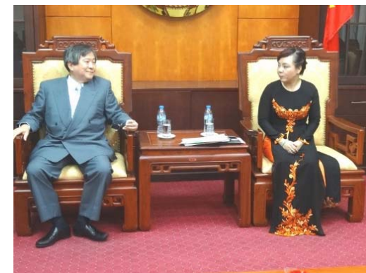
ゲン・ティ・キム・ティエン保健大臣との協議(2014.10)