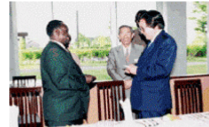
ボイト・カレッジ学長を表敬訪問(1998)