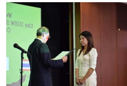
2014年度IUHW奨学金授与式 (2014.6)