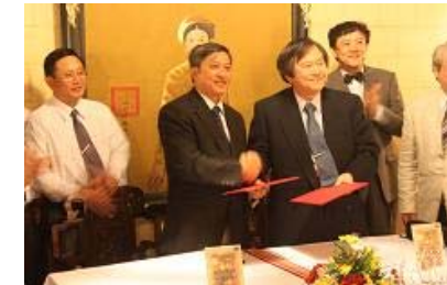
チョーライ病院との協定書締結 (2011.6)