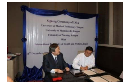
ヤンゴン医療技術大学との協定調印 (2013.12)