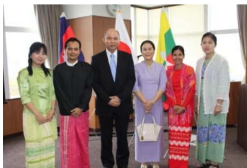
在日ミャンマー大使夫妻と2013年度IUHW奨学生 (2013.6)