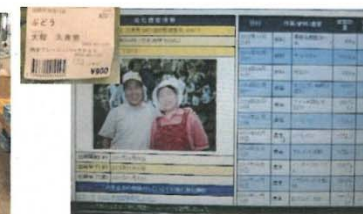
栽培履歴情報検索 (生産者・栽培情報はもとより農薬・肥料まで)