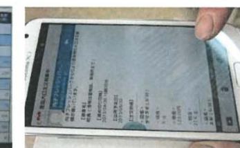
出荷者へ販売状況や必要農作物を随時配信