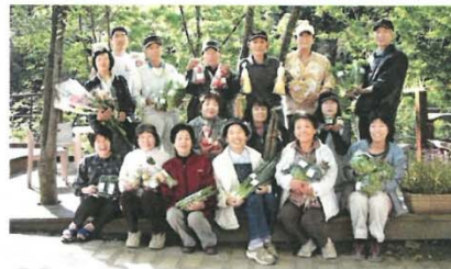
道の駅の企画・運営を支える生産者チーム