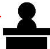
東京開業ワンストップセンター