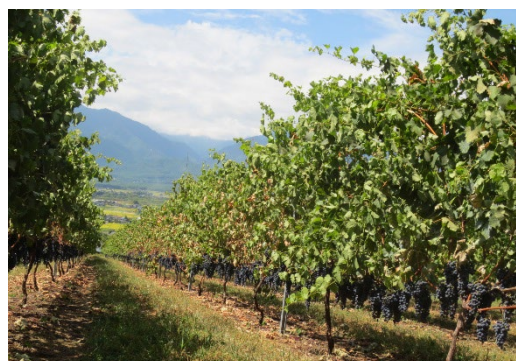
収穫を待つワイン用ぶどう