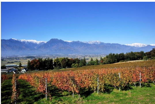
北アルプスと安曇野に抱かれた ぶどうの郷