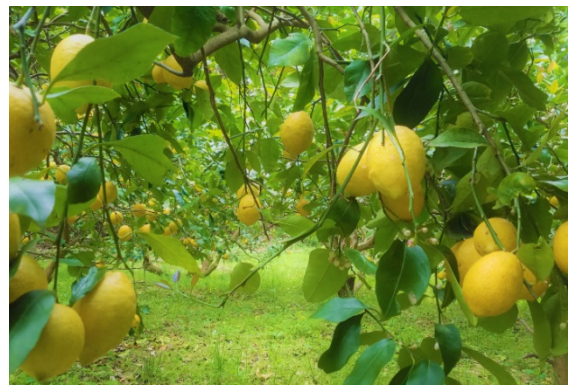
有機栽培のレモン畑の風景