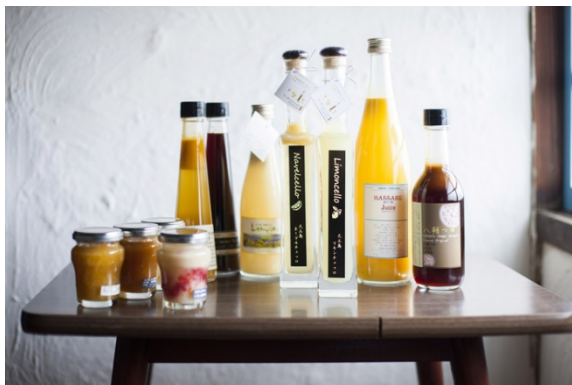
リキュール『大三島リモンチェッロ』