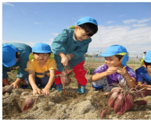
保育園のみんなと一緒に イモほりをした様子