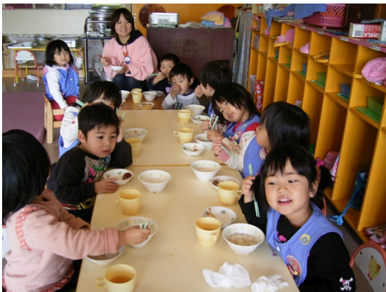
楽しい、おいしい給食の様子