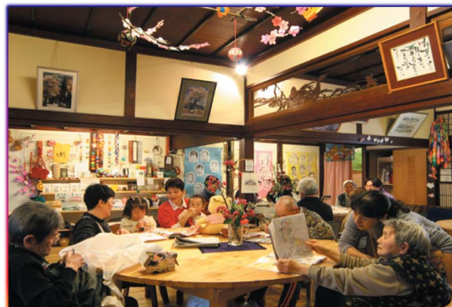
指定小規模多機能型居宅介護事業所における障 害児(者)の受入事業 【富山県、富山市、高岡市、立山町等 14件認定】

国の規制が皆様の活動や事業を妨げていませんか？ 実情に合わなくなった国の規制をお教えてください！