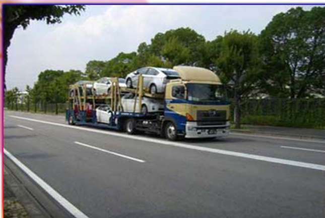
長大フルトレーラによる輸送効率化事業 【静岡県等 4件認定】