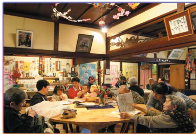
指定小規模多機能型居宅介護事業所における障 害児(者)の受入事業 【富山県、富山市、高岡市、立山町等 14件認定】

国の規制が皆様の活動や事業を妨げていませんか？ 実情に合わなくなった国の規制をお教えてください！