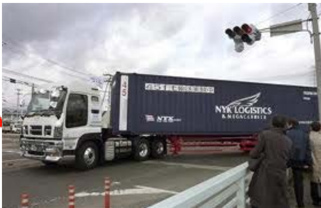
45フィートコンテナの輸送円滑化事業 【宮城県等 3件認定】