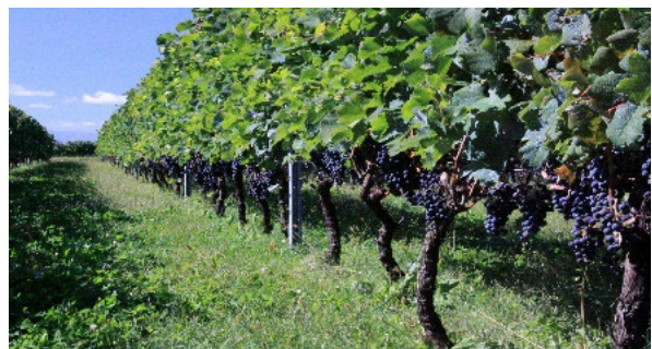
収穫を待つワイン用ぶどう