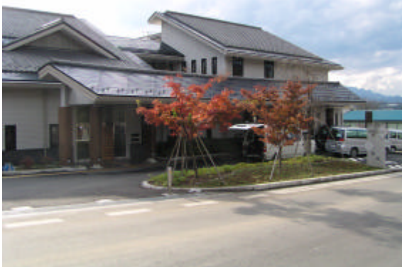
高篠デイサービスセンター