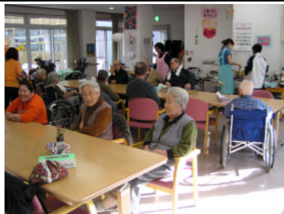
デイサービス事業