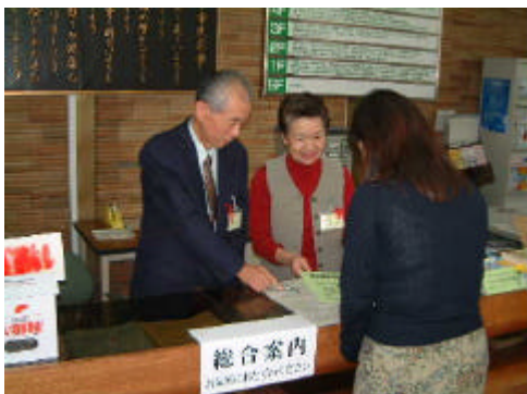
市民との協働を（行政パートナー）