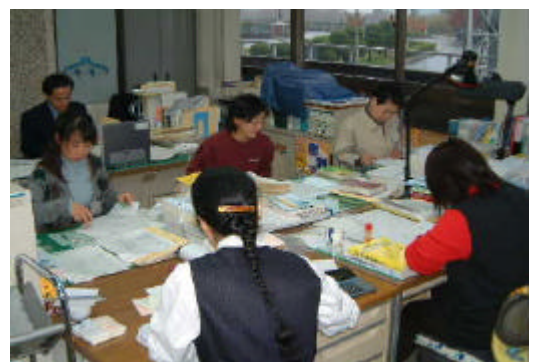
臨時的任用の活用を