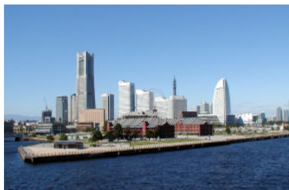
みなとみらい21地区