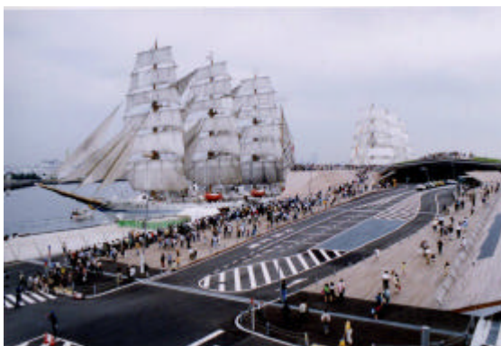
大さん橋国際客船ターミナル