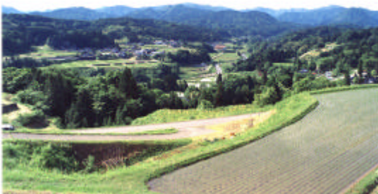
棚田百選「みのり地区」