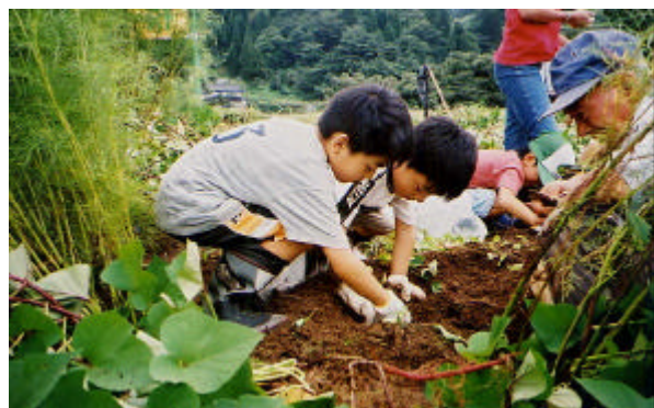
みのり棚田の学校