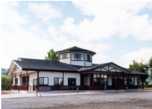
【交流拠点「蓼科農ん喜村交流促進センター」】