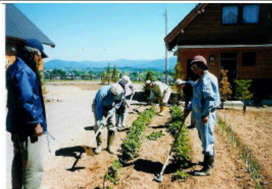
【市民農園農作業風景】