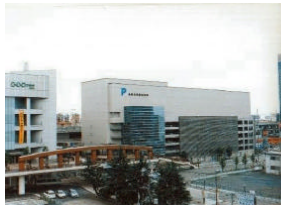
【岐阜市駅西駐車場 全景】