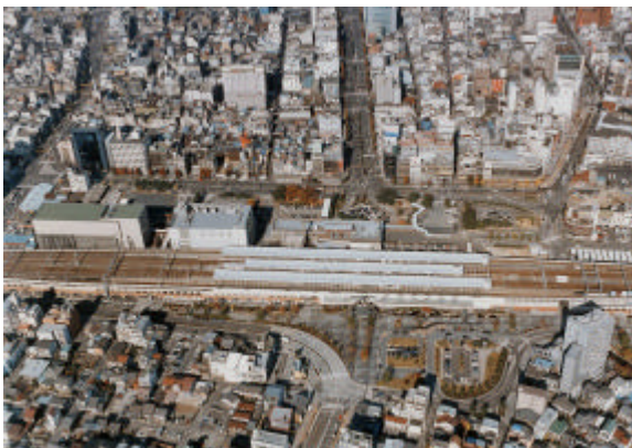
【JR 岐阜駅 周辺】