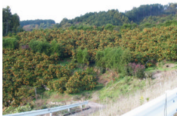
傾斜地に植えられている温州みかん