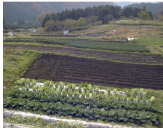
生産活動がなされている農地（野地区）