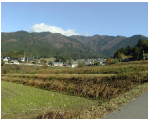
岡山県下最高峰の「後山」と後山地区