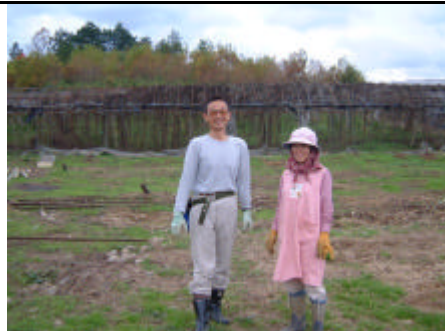
研修中の新規就農者