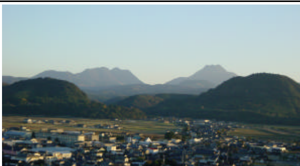
『安心の里』 安心院盆地