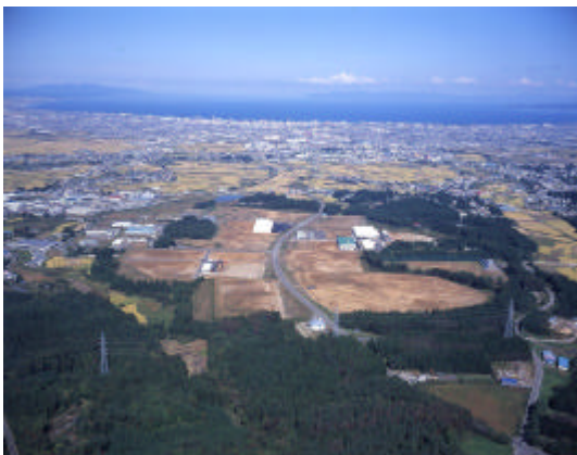
青森中核工業団地