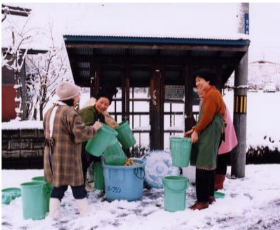
生産者と消費者の協働作業