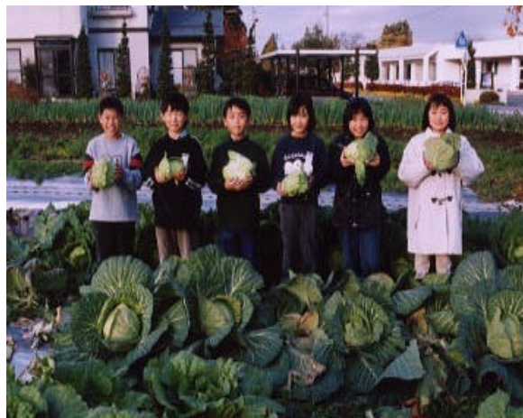
未来の農業を支える食農教育