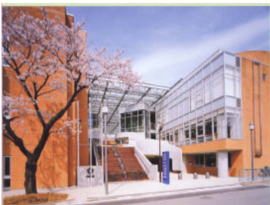
志木小学校（公民館・図書館との融合施設）