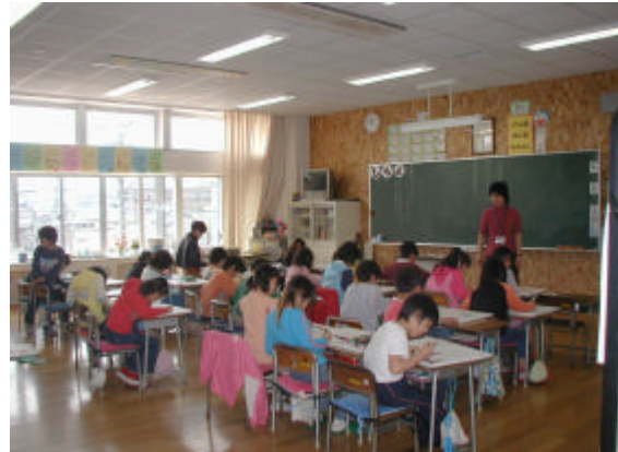
25人程度学級編制の実施