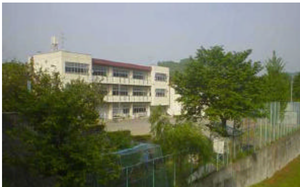
移転が予定されている現町立名倉小学校 (平成 17 年 3 月 31 日閉校予定)