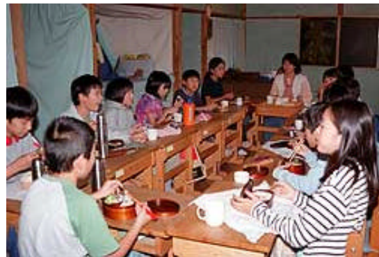
東京シュタイナーシュールの子どもたち