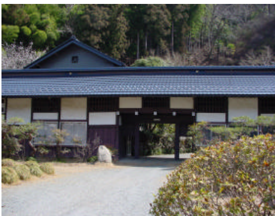
移転先として予定されている旧民間工場跡地