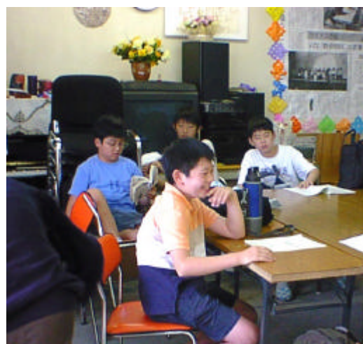
湘南ライナス学園の子どもたち