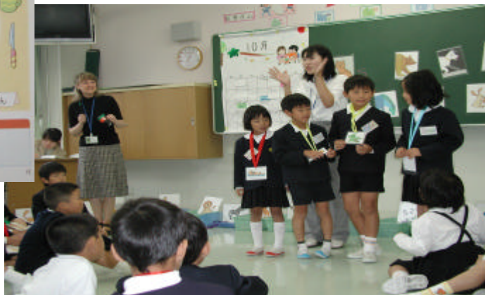
小学校での授業の様子