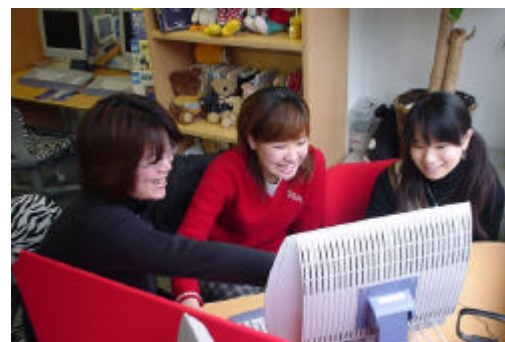
教員との面談風景