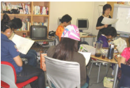
スクーリングの風景