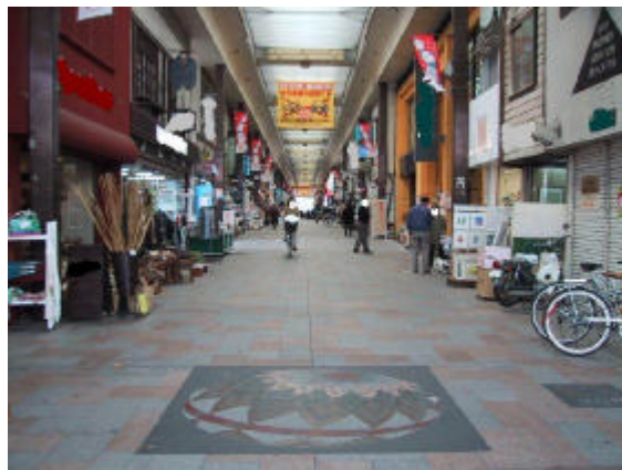
特区内のぶらぐ丁商店街