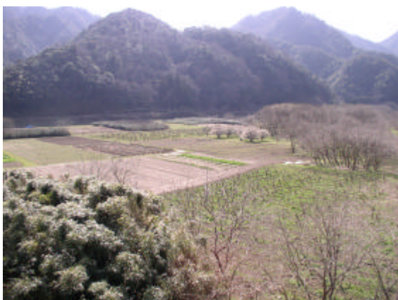
耕作放棄地が点在している中山間地域