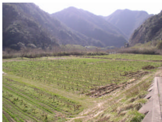
耕作放棄地を再生した 桑、麦（健康食材）栽培