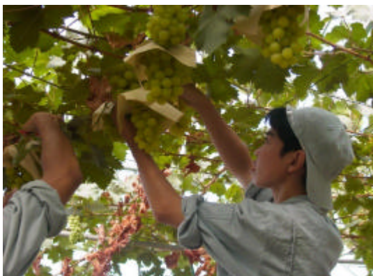
マスカット・オブ・アレキサンドリアの栽培