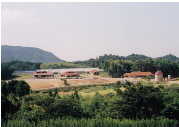
豊田町農業公園「みのりの丘」