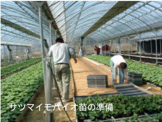
サツマイモバイオ苗の準備