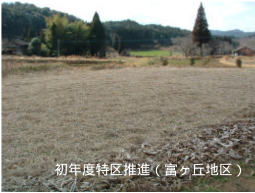
初年度特区推進(富ヶ丘地区)