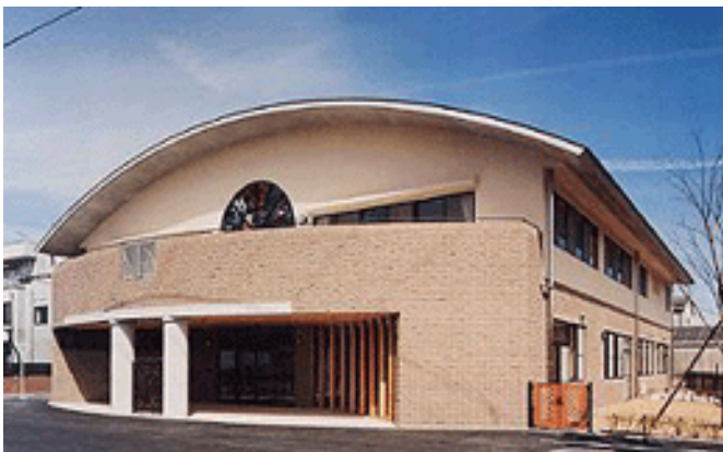
予定施設全景【ニコニコデイサービス鶴里】