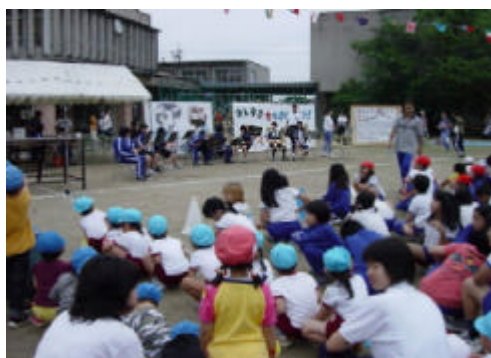
敬和小学校・東橋内中学校合同運動会