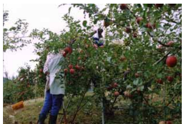
リンゴの収穫状況