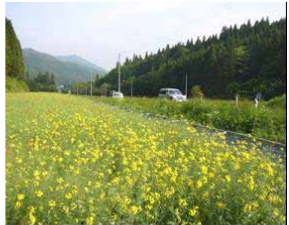
道路側の遊休農地を利用した「菜の花」栽培