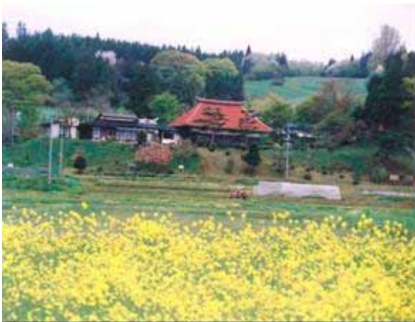
ナタネ油の一部はバイオディーゼルフUELとして活用