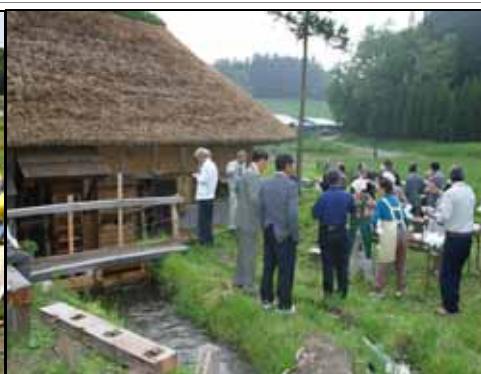
都市消費者との交流(水車小屋)