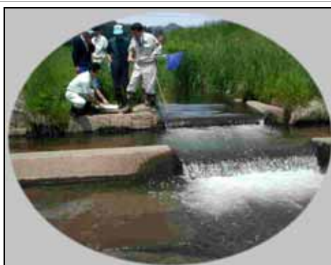
【イメージ】 よみがえった水資源