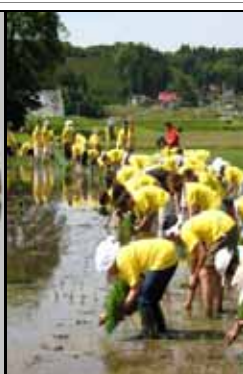
グリーンツーリズム(田植え体験)