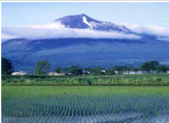
奥羽山系を源とする豊富な水資源により農業が営まれているが、未処理の生活雑排水による水質悪化が問題となっている。「写真：岩手山と西根町の水田地帯」