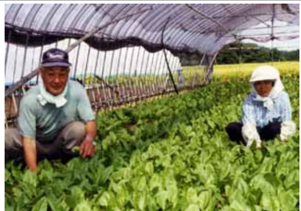
「写真：西根町特産の雨よけホウレンソウ」 污水处理施設の整備を進めることで、豊かできれいな水で作る西根型農業の更なるイメージアップ、ブランド化を推進