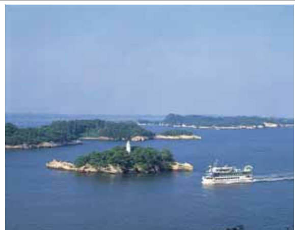
【観光遊覧船による島巡り】