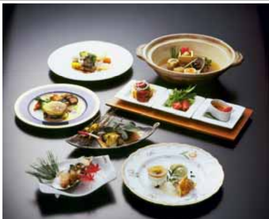
【地場産食材を使った新料理】