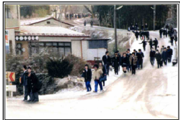
本吉駅前線の通学状況