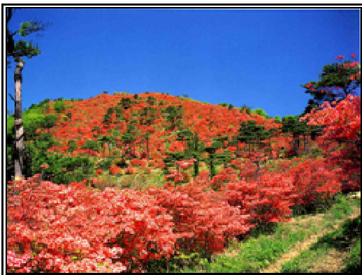
徳仙丈山のつつじ