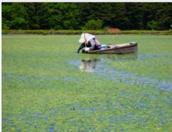
じゅんさい摘み採り風景