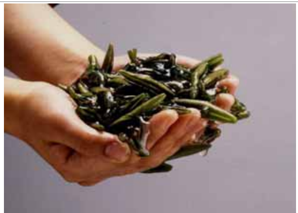
採れたてのじゅんさい