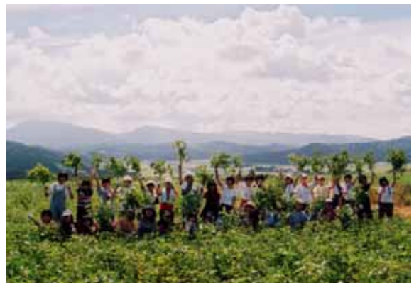
都会から修学旅行を受入れ（ファームステイ）