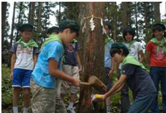
地域の子供たちにしっかりと「緑」を伝え