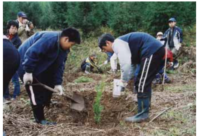
自然の中で体験学習