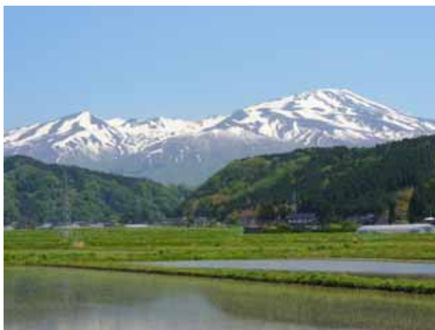
鳥海山を活用した観光