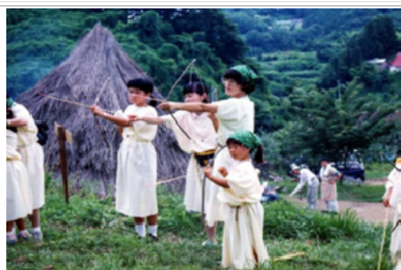
「縄文の里」での原始生活体験