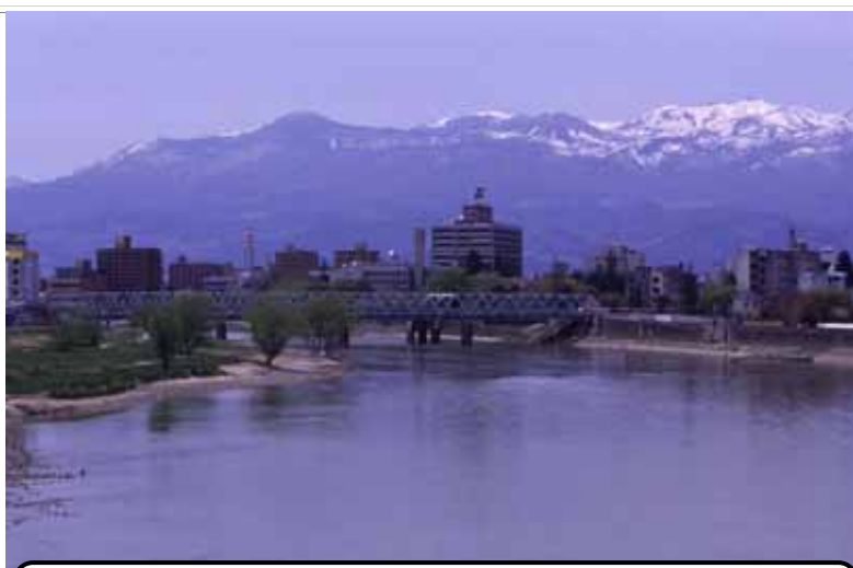
吾妻連峰を背景に福島盆地の中央を流れる阿武隈川