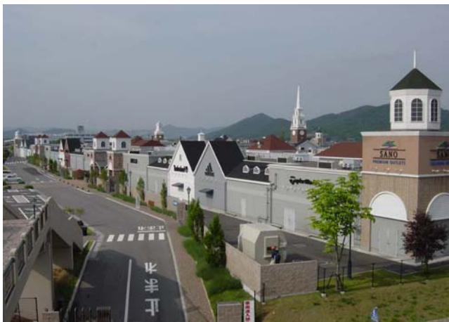
佐野IC付近都市エリア (アウトレットショッピングセンター)