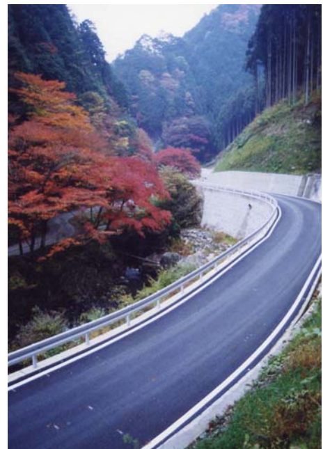
蓬萊神社付近林道(佐野市作原町)